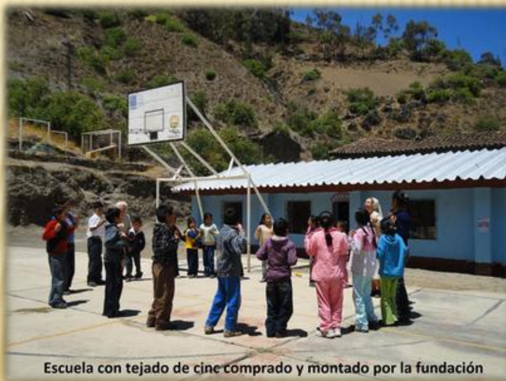
Escuela con tejado de cine comprado y montado por la fundación

Uno de los primeros proyectos de la Fundación fue cambiar los tejados del colegio y de 15 viviendas.